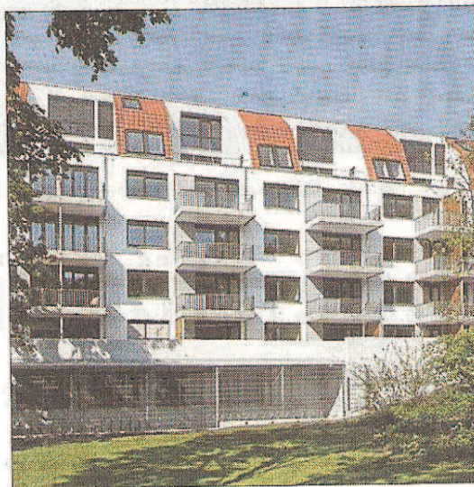
Nach 14 Monaten Bauzeit wurde das fünfgeschossige Gebäude fertiggestellt.